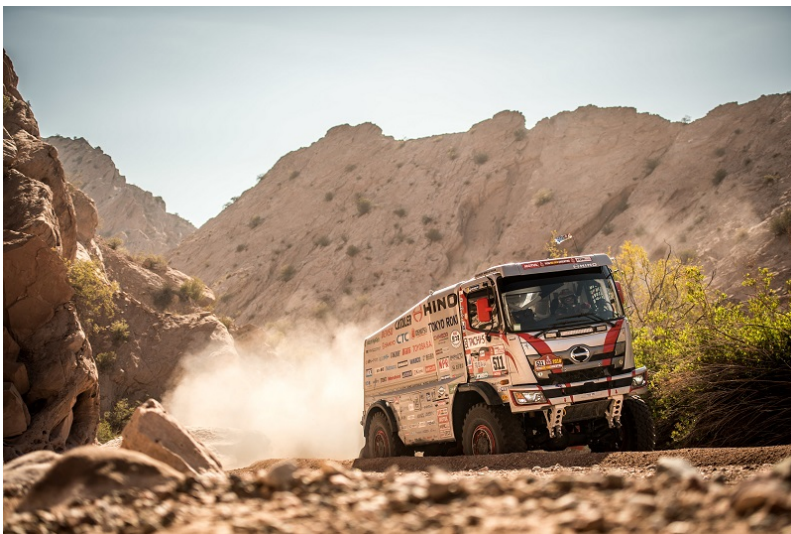
「ダカールラリー2018」にて荒野を駆ける日野レンジャー

当社は2016年より、日野自動車株式会社(本社:東京都日野市、社長:下 義生)と日本レーシングマネジメント株式会社(代表:菅原 照仁)による『日野チームスガワラ』に協賛しております。2019年も引き続き協賛するとともに、同チームのレーシングトラック「日野レンジャー」へ当社のオイル開発技術と知見を生かした、特別仕様のレース用エンジンオイルとギヤオイルを供給し、同チームの「ダカールラリー」10連覇への挑戦を応援します。