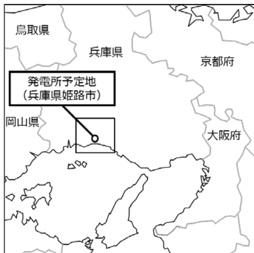
< 広域図 >